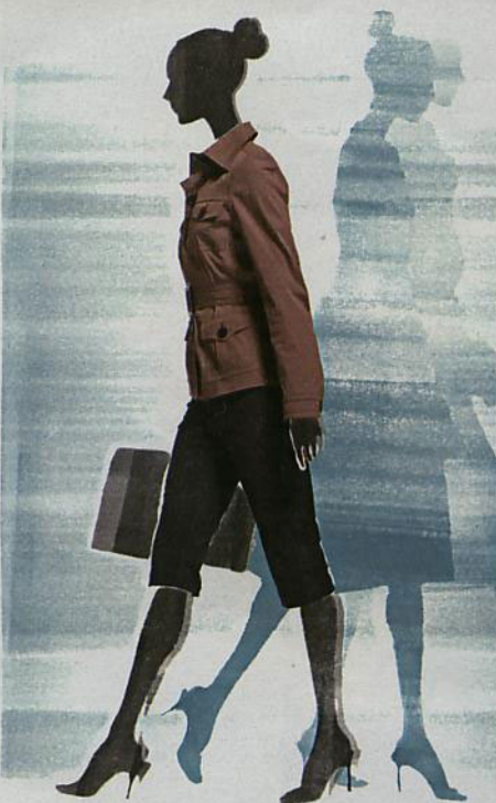
Bermuda mit Nadelstreifen und Sakko, von René Lezard.